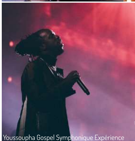
Youssoupha Gospel Symphonique Expérience