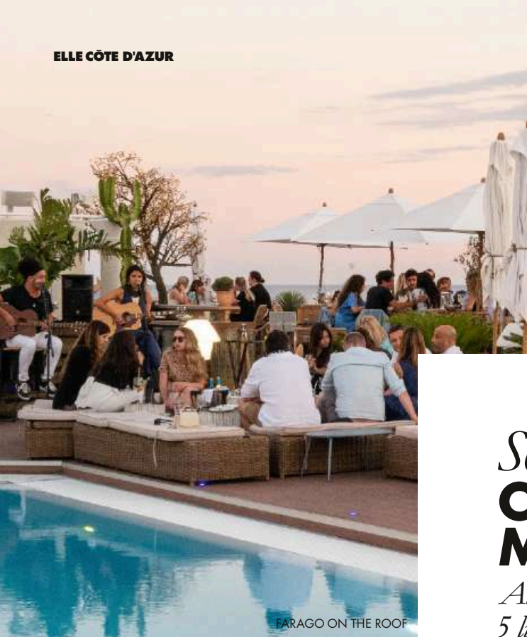
FARAGO ON THE ROOF