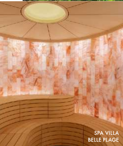
SPA VILLA BELLE PLAGE