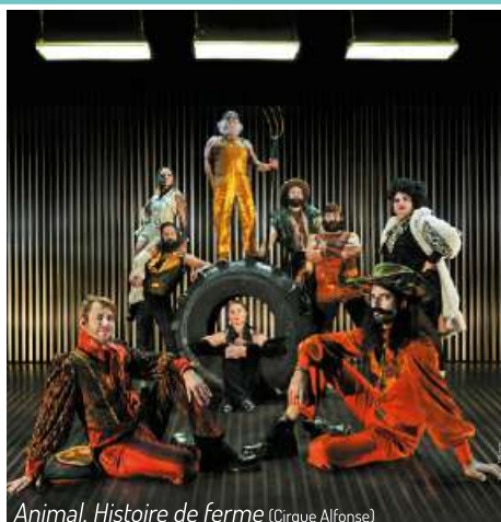
Animal, Histoire de ferme (Cirque Alfonse)

THÉÂTRE / DANSE / MUSIQUE / HUMOUR / NOUVEAU CIRQUE / JEUNES PUBLICS