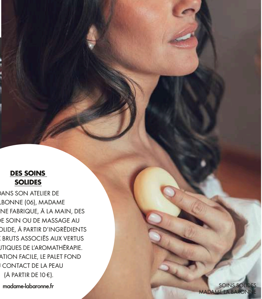
SOINS SOLIDES MADAME LA BARONNE