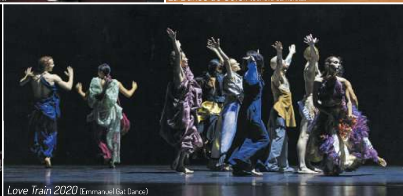
Love Train 2020 (Emmanuel Gat Dance)