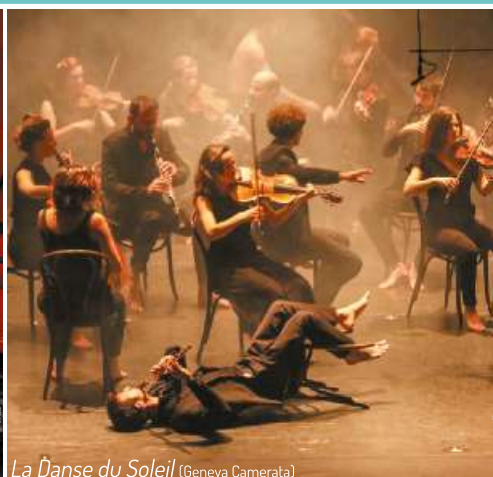
La Danse du Soleil (Geneva Camerata)