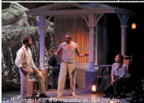
La Maison du Loup, À la rencontre de Jack London