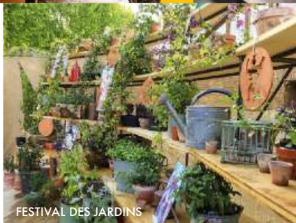
FESTIVAL DES JARDINS

DES JARDINS ÉPHÉMÈRES vont fleurir un peu partout dans les Alpes-Maritimes, dans le cadre d'un concours international. À découvrir du 25 mars au 1 er mai, dans les plus beaux parcs de la Côte d'Azur et de Monaco... ●