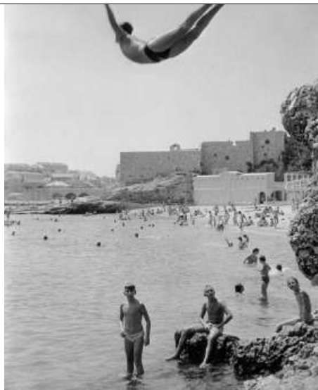
« Marc Riboud, 100 photographies pour 100 ans » – « Plongeur », Yougoslavie, Dubrovnik, 1953.

Jusqu'au 31 décembre. 86, quai Perrache, Lyon (69). museedesconfluences.fr. 6 et 9 €.